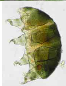
クマムシの一種