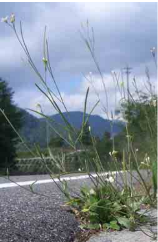
道路脇に生えていることも。