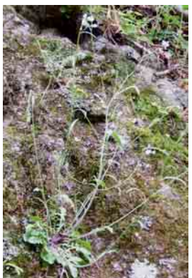
自然の岩場で咲く。

につな갑니다。また、地球が温暖化する時に生き物がどうなるのかを予測し、対策を考えるヒントを見つけることが