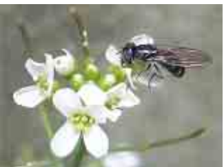
白い花にはハエやアブがやってくる。

つています。一方、ミヤマハタザオは自分の力で、高山で子孫を残します。その意味では、標高に対する万能性は、ミヤマハタザオに軍配が上がるでしょう。