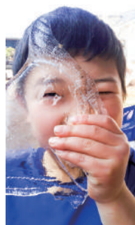
水の穴から見えるよ!

本来の脳が育っていきます。自然のなかで遊ぶことは、いろいろな能力を引き出す力があり、脳の発達や人間関係づくりの基礎になるといわれています。原体験をたくさんすることで育った非認知能力は、認知能力を伸ばします。