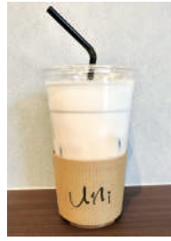
ティラテ(450円) ふわふわの泡にはヒミツがあるそうです。 ・アーモンドシロップをチョイス。風味豊かで好相性です。

「uni」という店名には誰でも気軽に立ち寄り、自由に過ごしてほしいという思いが込められているそうです。オススメは、15種類ものフレーバーがある「アガベシロップ」。1シヨツト40円。お好みのミルクやラテをつくるができます。