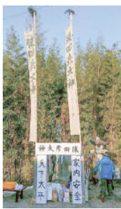
2018年1月 石神の道祖神祭り