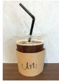
アイスコーヒー(450円) キリッとした苦みにシロップで自分好みに！ ・ミントシロップをチョイス。ほんのり甘くてあと味すっきりです。

コーヒー以外にもハーブティーなどのカフェインレスドリンクもあり、「アトックスレモネード」(530円)など、体の中からキレイになりそうなものばかり。 屋外カウンターで注文をするので、テイクアウトや店内、お好きな場所でゆっくりといただけます。