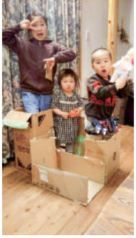
段ボールハウスで大はしゃぎ!