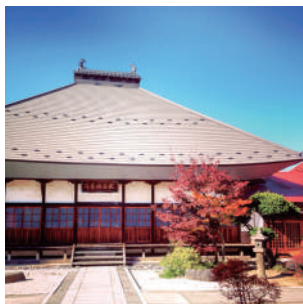
長昌寺(ちょうしょうじ) 上田市長瀬 2604 ☎0268-43-2015

寺ヨガとは ヨガはサンスクリット語で「結びつける」という意味があります。お寺の浄らかな空気のなかで、心とカラダとを結び調えるのが「寺ヨガ」です。