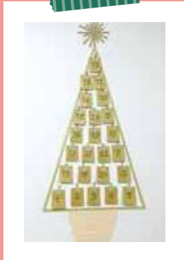
数字を書いた封筒に、折り紙で作ったオーナメントを入れツリーに貼る。