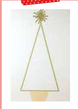
マスキングテープで壁にツリーを描く。