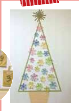
毎日1つずつ封筒を開き、オーナメントを貼る。イブにはツリーが完成★