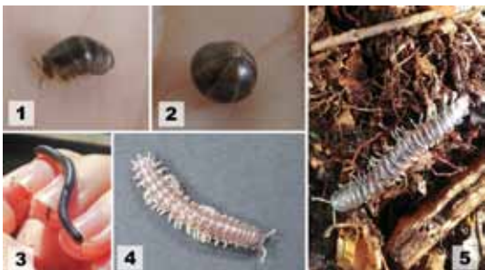
写真1. 菅平で見られるヤスデ達 1: タマヤスデ。ダンゴムシとそっくりなヤスデです。2: タマヤスデが丸まった様子です。3: クロヒメヤスデ。丸っこくて細長い体の特徴です。4: タカクワヤスデ。茶色の体に朱色の縁が特徴的です。5: ニクイロババヤスデ、この写真の中では一番大きい大型のヤスデです。

1976年の秋、山梨県小淵沢駅から長野県小諸駅を走る列車を止めた伝説のヤスデがいます。体長約35mmほどの小さい生き物がどうやって列車を止めたのか、気になりますか？この