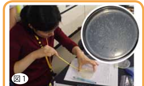
図1 モデル生物多様性実習の様子。花蜜を培地にまいているところ。右上が寒天培地上に現れた野生酵母のコロニー。

さて、大隅博士がオートファジーという細胞の現象を解明するのに使われた材料は酵母です。「酵母」とは、狭義にはコウボキン(学名 Saccharomyces cerevisiae ) 1種を指し、