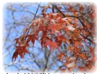
↑ まだ紅葉していたイロハモミジにも雪が積もっていました。