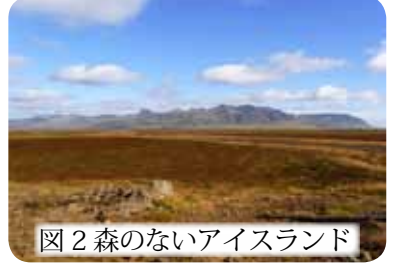
図2 森のないアイスランド