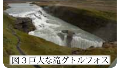
図3 巨大な滝グトルフォス