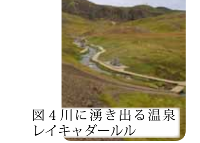
図4 川に湧き出る温泉レイキヤダール