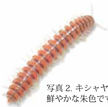
写真2. キシャヤスデの成体。鮮やかな朱色です。

伝説のヤスデは、名を「キシヤヤスデ」と言います。名前は汽車を止めたこと由来しています。彼らは紅葉のような鮮やかな朱色をしている、大人しくかわいらしい生き物です(写真2)。彼らは一生の大半を地中で過ごし、1年に1回脱皮をして、少しずつ大きくなります。そして8年目にやっとのことで成体となって地上に現れ、パートナーを探す旅に出ます。そうです、彼らは8年に1回大発生をするヤスデなのです。1976年はちょうどキシヤヤスデ大発生の年で、列車はひかれたヤスデの体液でスリップし動けなくなってしまうのでした。キシヤヤスデが最も活発になる時期は9月